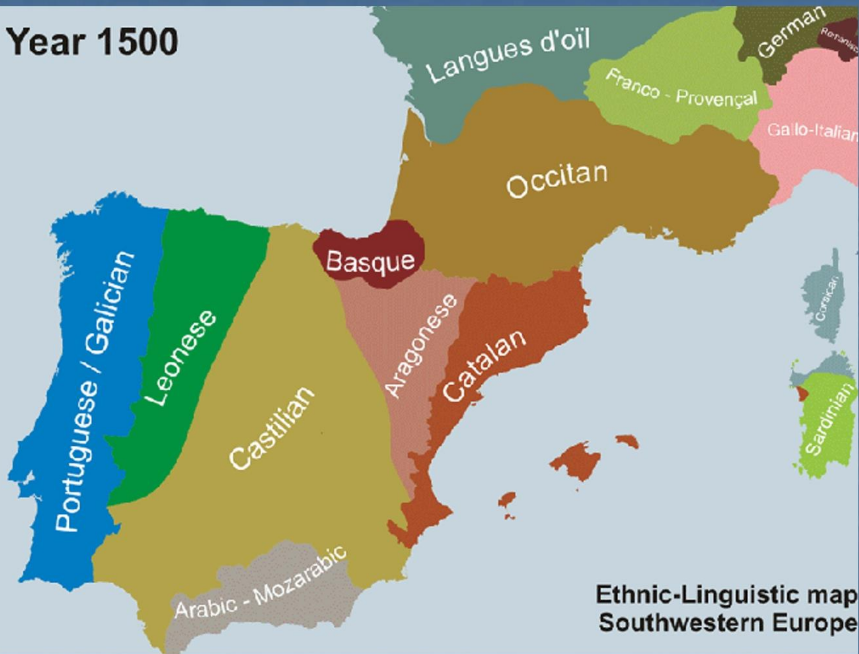
Ethnic-Linguistic map Southwestern Europe